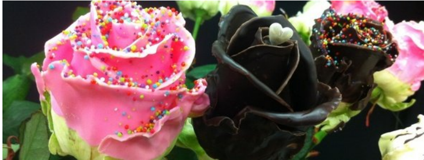
Las rosas inspiradas en la repostería son la novedad de este año M.C.G.

L'H y Baix Llobregat | 20/04/2015 - 09:52h | Última actualización: 23/04/2015 - 09:43h