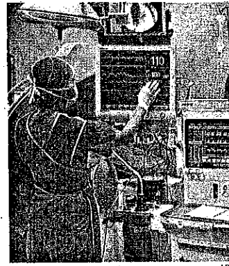
Centro «Jesús Usón», en Cáceres

Diez años celebra estos días un pionero centro de investigación y formación biomédica asentado en el corazón de Extremadura y centrado originalmente (ahora amplía sus objetivos) en las técnicas y equipos quirúrgicos de mínima invasión. La exitosa experiencia del complejo Jesús Usón debe servir para estandarizar la idea de que la innovación puede asentarse allí donde surge la idea y que no solo se alberga y arracima en los grandes polos alrededor de grandes capitales. La localización geográfica es un aspecto secundario que siempre cede paso a quien decide apostar por el talento.