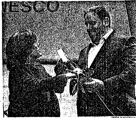
Sáenz de Santamaría y Oriol Junqueras

El sector separatista puso ayer negro sobre blanco su disposición a vulnerar la ley con el referéndum ilegal. No está mal que el gabinete de Puigdemont le vaya adelantando trabajo a la Fiscalía, ya que se señalarán a sí mismos como futuros delincuentes. Terminado el paripé, a Junqueras, uno de los firmantes, no le importó compartir foto con Soraya Sáenz de Santamaría, que acudió a apoyar la candidatura de la Fiesta de Sant Jordi a patrimonio de la Unesco. Se pillan antes a un mentiroso que a un cojo, y antes aún a un secesionista a tiempo parcial.