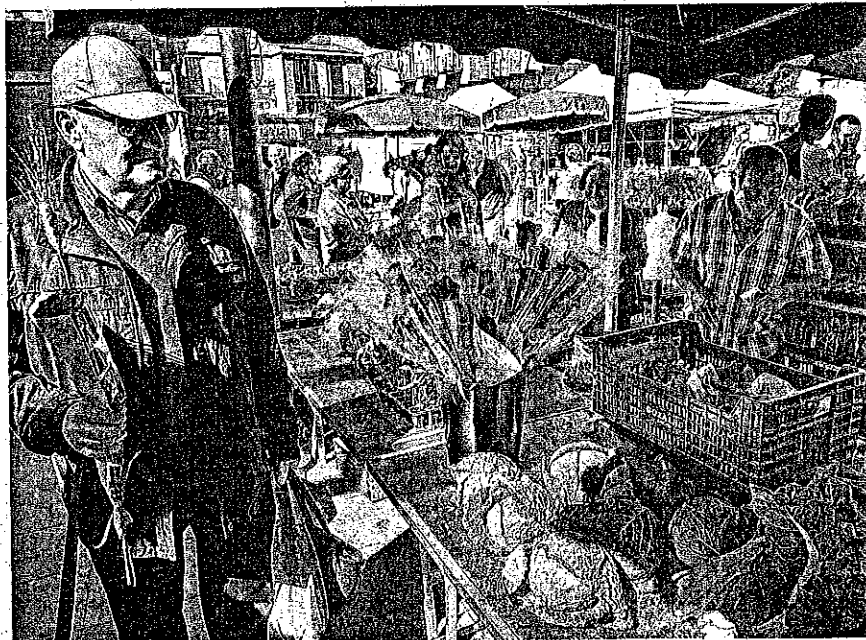
Al mercat de Sant Feliu, el planter i les cols es barrejaven amb les roses. DAVID BORRAT

Lleida es va decantar per la novel·la negra amb Assassins de Ponent (Llibres del Delicte), escrita per diversos autors lleidatans. La nit contra tu (Proa) de Ferran Sáez també va sobresortir a la capital de Ponent. Arreu de Catalunya es va viure una jornada assolada que va afavorir que els ciutadans omplissin els carrers de les capitals de província a la recerca de roses i llibres.