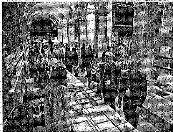
► Expositores en la feria Arts Libris, ayer.

La feria vuelve a ser un encuentro de editores, autores y coleccionistas al que se suma el público que curiosa entre los libros de artista y bibliofilia. Según la directora de Arts Li-