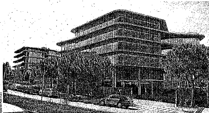
La sede de la multinacional de los hemoderivados Grifols.

Grifols ha adquirido seis centros de extracción de plasma en Estados Unidos a la compañía italiana Kedrion en una operación valorada en 47 millones de dólares (44 millones de euros). La multinacional de hemoderivados tiene actualmente en marcha un plan de crecimiento para alcanzar los 225 puntos de donación en el año 2021. La compañía tiene previsto invertir 300 millones en nuevas aperturas, además de realizar operaciones corporativas selectivas. La farmacéutica catalana tiene ya 177 centros operativos. P3