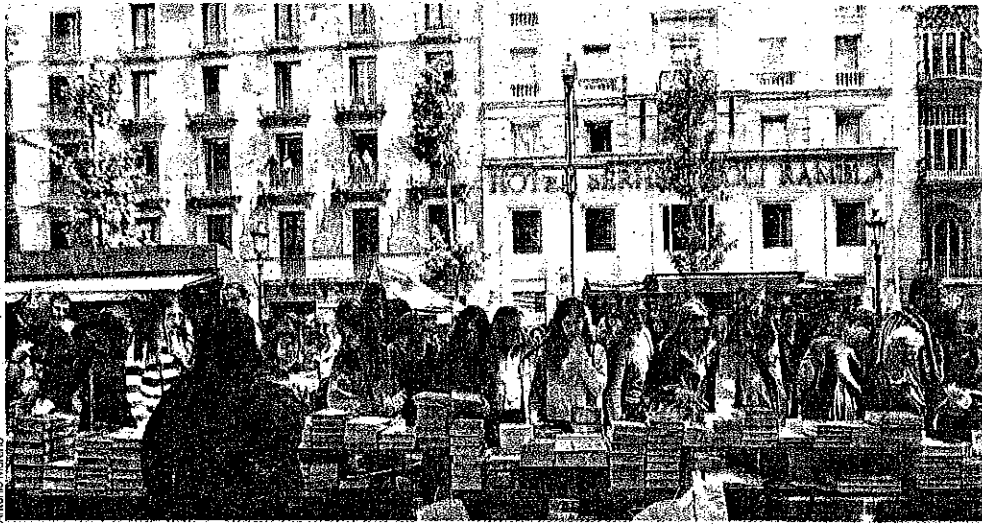
Barcelona contará este Sant Jordi con 3.888 paradas de rosas, 918 paradas de libros y 4.806 de pan en sus calles.

Competencia El Gremi de Floristes de Catalunya estima que este año se lleguen a vender 6 millones de rosas en toda Catalunya; dos millones de ellas a través de la venta en tienda y el resto en paradas en la calle. Barcelona contará este año con 3.888 paradas de rosas, con un