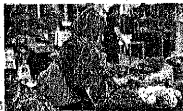
Este año Barcelona contará con 3.888 paradas de rosas y 918 paradas de libros.

Los tres gremios que conforman la actividad comercial del día de Sant Jordi -libros, flores y pan- prevén una jornada con unas ventas parecidas a las de 2016. La celebración caerá en día festivo, lo que hará que más gente acuda al centro de Barcelona, pero de manera escalonada. P8