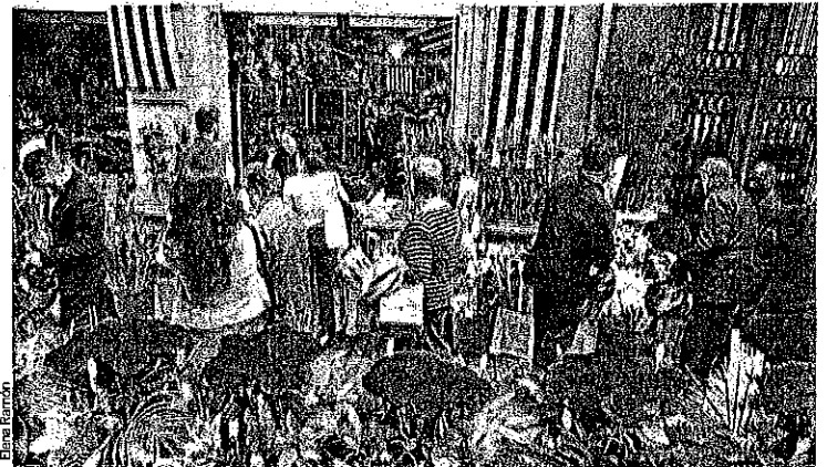
El Gremi de Floristes prevé que este año se lleguen a vender 6 millones de rosas en Catalunya.

Unesco reconoció a Barcelona como Ciudad de Literatura, reconociendo su papel central, tanto por ser localidad de origen de muchos autores, como por ser escenario de muchas obras literarias famosas. Ya están incluidos en la lista del Patrimonio Inmaterial de la Unesco las Fallas de Valencia, la fiesta de los patios de Córdoba, el Canto de la Sibila de Mallorca, el flamenco, el Misterio d'Elx o la Patum de Berga.